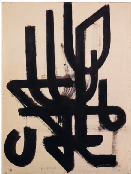
Pierre Soulages, Brou de noix sur papier 100 x 75 cm, 1948. Collection privée