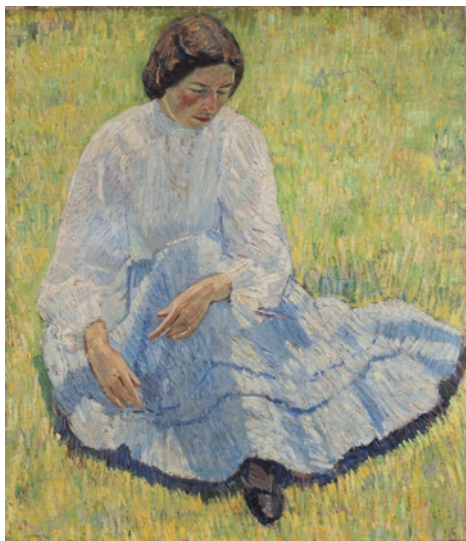
Robert Falk, Lisa in der Sonne , 1907. 94,5 x 81,7 cm. Huile sur toile Musée d'État des beaux-arts de la République du Tatarstan, Kazan