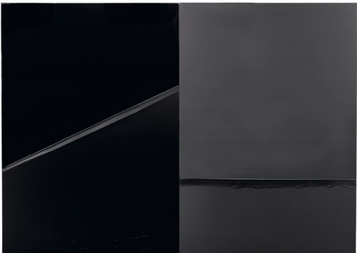
Pierre Soulages, Peinture 222 × 314 cm, 24 février 2008 . Acrylique sur toile, Diptyque, chacun 222 × 157 cm. Collection privée; photo: Vincent Cunillère