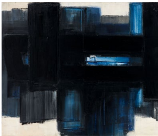
Pierre Soulages, Peinture 89 x 130 cm, 7 juillet 1957–1958. Huile sur toile. Sprengel Museum Hannover, Kunstbesitz der Landeshauptstadt Hannover

Cette exposition rétrospective offre un parcours de l'œuvre du peintre et en montre la remarquable cohérence en dépit de sa longévité exceptionnelle. Dès ses débuts, Soulages a opté pour une abstraction totale, mettant en question les données traditionnelles de la peinture. Par les matériaux qu'il emploie (brou de noix, goudron...), par ses outils qui renvoient souvent à ceux des peintres en bâtiment, par son choix d'identifier ses toiles par la technique, les dimensions et la date de réalisation, plutôt que de choisir un titre orientant la vision, il adopte une position singulière dès 1948 lorsqu'il écrit : « Une peinture est un tout organisé, un ensemble de formes (lignes, surfaces colorées...) sur lequel viennent se faire et se défaire les sens qu'on lui prête ».