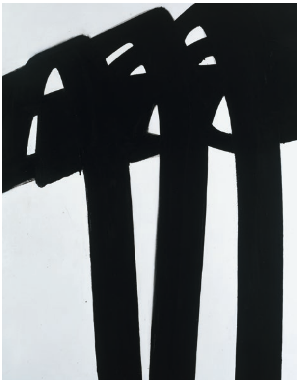
Pierre Soulages, Peinture 190 x 150 cm, 1970 . Huile sur toile Collection privée; photo: Archives Soulages