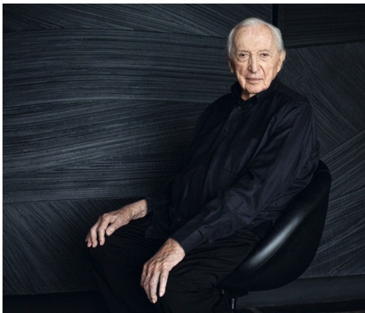
Pierre Soulages

Né le 24 décembre 1919 dans le sud-ouest de la France à Rodez, Soulages a fêté son centième anniversaire par une prestigieuse exposition au musée du Louvre en 2019. Il continue de peindre à un rythme soutenu comme en témoignent ses récentes toiles de grand format, signe de la vitalité remarquable de cet artiste qui persiste dans ses recherches sans discontinuer.