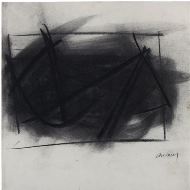
Pierre Soulages, Fusain sur papier 39,3 × 39,3 cm, 1946. Musée Soulages, Rodez Donation Pierre et Colette Soulages, 2005

An exhibition of Museum Frieder Burda and Kunstsammlungen Chemnitz.