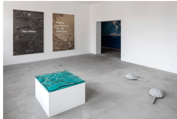
Installationsansicht / Installation view: Tue Greenfort , Seascape I , 2017. Glas / glass und Detail / and detail: Horseshoe Crab #02 – #06 , 2017. Beton / concrete; Timur Si-Qin , Untitled [Sacred Matter Panel 1] , 2017. Inkjet print on aluminium sandwich panel. Courtesy the artist and Soci t .