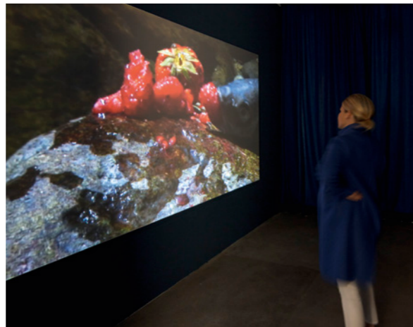
Installationsansicht / Installation view: Laure Prouvost , Swallow , 2013. Video: 12:07 Min. Courtesy the artist and Collezione Maramotti, Reggio Emilia, Italy.

Dahingegen bietet uns David LaChapelle einen spekulativen Blick in die Zukunft. Seine vom tropischen Regenwald überwucherten Tankstellen, die wie künstliche Settings von Mystery-Filmen wirken, zeigen menschliche Architekturen, die in einer post-humanen Zukunft vergessen sein würden. Die Virtual Reality-Arbeit The Bridge (2017) von Nikita Shalenny nimmt uns mit in eine Endzeitwelt, in der schemenhafte Silhouetten nackter Menschen durch geisterhaft leere Landschaften, abgestorbene Wälder und vorbei an verlassenen Ölpumpen um ihr Leben laufen. Auch Tim Eitels Figuren auf einem Boot steuern nicht mehr auf eine morbide-romantische Insel, sondern ins Nichts und gleichzeitig auf eine Wand zu. Beide Werke erinnern heute unweigerlich an globale Herausforderungen wie die aktuelle Flüchtlingskrise, repressive totalitäre Systeme und die voranschreitende Zerstörung der Umwelt.