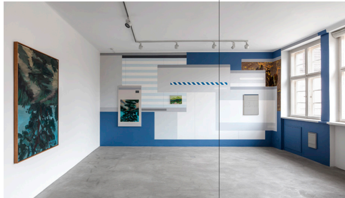
Installationsansicht / Installation view: Georg Baselitz , Eschenbusch II , 1969. Öl auf Leinwand / oil on canvas. Courtesy Museum Frieder Burda, Baden-Baden. © Georg Baselitz 2018; Flavio de Marco , Mimesi.05 , 2000/2018. Acryl auf Wand, Acryl und Öl auf Leinwänden / acrylic on wall, acrylic and oil on canvases. Courtesy the artist.