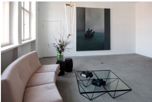
Installationsansicht / Installation view: Tim Eitel , Boat , 2004. Öl auf Leinwand / oil on canvas. Courtesy the artist and Abis Kunstsammlung; Nikita Shalenny , The Bridge , 2017. Virtual Reality Artwork. Courtesy the artist and Khora Contemporary.

Tue Greenfort formuliert ein entschiedenes Bekenntnis zur Natur und zur Verstrickung allen Lebens jenseits von Dichotomie, in dem er ihr ästhetisches Potential selbst aus dem wissenschaftlichen Zugang zu ihr herauskitzelt. Timur Si-Qin avanciert in seinen digital gerenderten Landschaften der neuen New Peace -Serie (2017) ein Konzept der Immanenzphilosophie. Der Serie unterliegt ein von ihm formuliertes „Protokoll“, um den eigenen Platz in der Weite von Zeit und Raum zu verstehen, eine Mystik für eine Welt im Griff des Anthropozäns und die somit tiefgreifenden Veränderungen unterlegen ist.