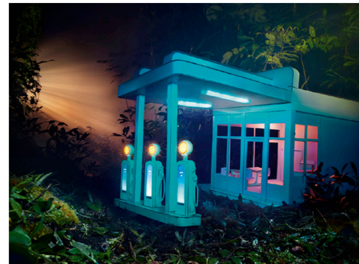
David LaChapelle , Gas 76 , 2012. C-print. Courtesy David LaChapelle Studio © David LaChapelle