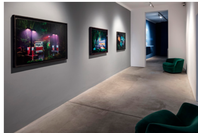
Installationsansicht / Installation view: David LaChapelle , Gas Chevron / Gas am pm / Gas 76 , all 2012. C-prints. Courtesy David LaChapelle Studio © David LaChapelle; Sissel Tolaas , Ocean SmellScape , Archive 2016_2050. Weltkarte und Geruchsmoleküle / world map and smell molecules. Courtesy the artist.