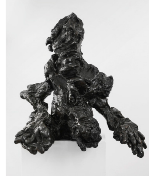
Willem de Kooning, Large Torso , 1974. Bronze, ca. 95 × 91 × 70 cm. Museum Frieder Burda, Baden-Baden

The show opens with works from the series of installations A Thief Caught in the Act (Flock of Birds) , 2015. Various birds modeled by Djurberg are about to steal colorful pills. Spotlights picking them out at intervals suggest a police operation, making the beholder a witness to what would seem to be the enactment of a forbidden desire. On view in the first gallery are three more recent videos by Djurberg & Berg, including the animation Worship (2016), in which modeling-clay figures use various objects with sexual connotations – bananas, donuts, corncobs, sausages – to satisfy their urges. These objects also feature in the eleven-part wall installation of the same title.