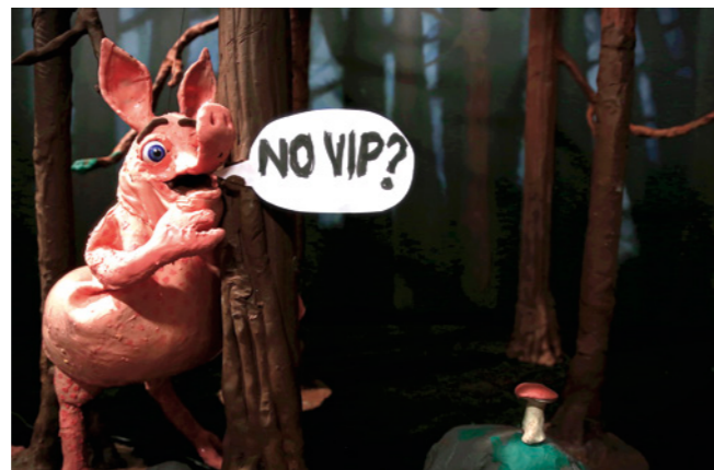
Nathalie Djurberg & Hans Berg, Dark Side of the Moon , 2017. Claymation, Musik, 06:40 Min. Courtesy the Artists, Giò Marconi, Milan, and Lisson Gallery, London.

Les « terribles » femmes de Djurberg & Berg, séductrices, démons, sorcières et mères omnipotentes, rappellent le célèbre cycle Woman de de Kooning datant du début des années 1950. Comme chez de Kooning, le corps que l'art a transformé et déformé permet d'accéder aux dispositions psychiques refoulées – en partant toutefois de prémices parfaitement distinctes. Djurberg utilise la déformation pour opérer parfaitement consciemment une réflexion sur les stéréotypes et rapports de force qui règnent dans un univers dominé par les hommes. Le processus artistique de Djurberg & Berg est, comme pour de Kooning, déterminé par l'intuition, par le rapport direct avec le support artistique et le traitement physique de ce dernier.