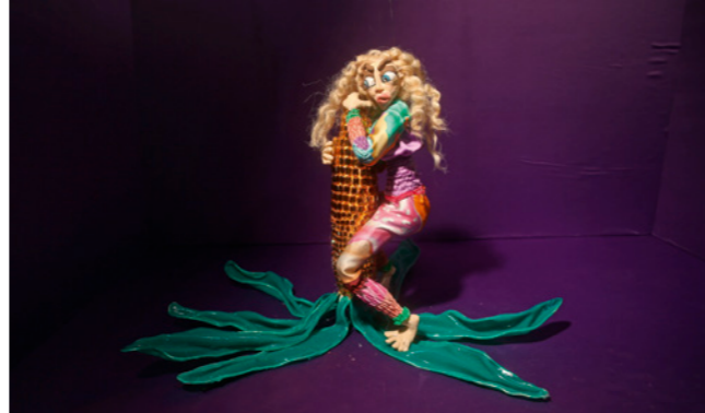
Nathalie Djurberg & Hans Berg, Worship , 2016. Claymation, Musik, 08:26 Min. Courtesy the Artists, Giò Marconi, Milan, and Lisson Gallery, London.

L'exposition s'ouvre sur des œuvres faisant partie de la série d'installations A Thief Caught in the Act (Flock of Birds) , 2015. Divers oiseaux modelés par Djurberg sont en train de voler des pilules multicolores. Ils sont éclairés par intervalles comme par les phares d'un véhicule de contrôle policier, le spectateur devenant alors pratiquement témoin d'une infraction, d'un acte interdit de satisfaction de plaisir. La première salle d'exposition montre trois vidéos récentes de Djurberg & Berg, en particulier l'animation Worship (2016), dans laquelle des figures en pâte à modeler se défoulent sur des objets aux diverses connotations sexuelles : bananes, donuts, épis de maïs, saucisses. Ces objets se retrouvent également dans une installation murale en onze parties portant le même titre.