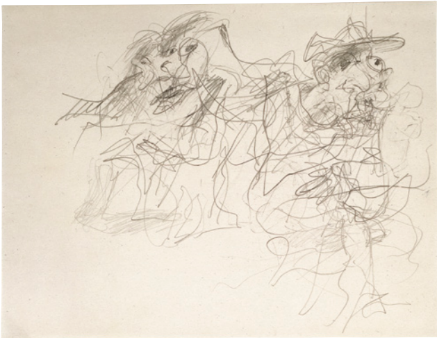
Willem de Kooning, Untitled , 1965/80. Bleistift auf Papier, 21,6 × 27,9 cm. Museum Frieder Burda, Baden-Baden